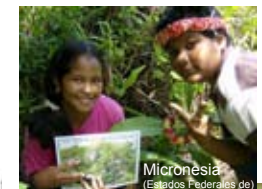
Micronesia (Estados Federados de)